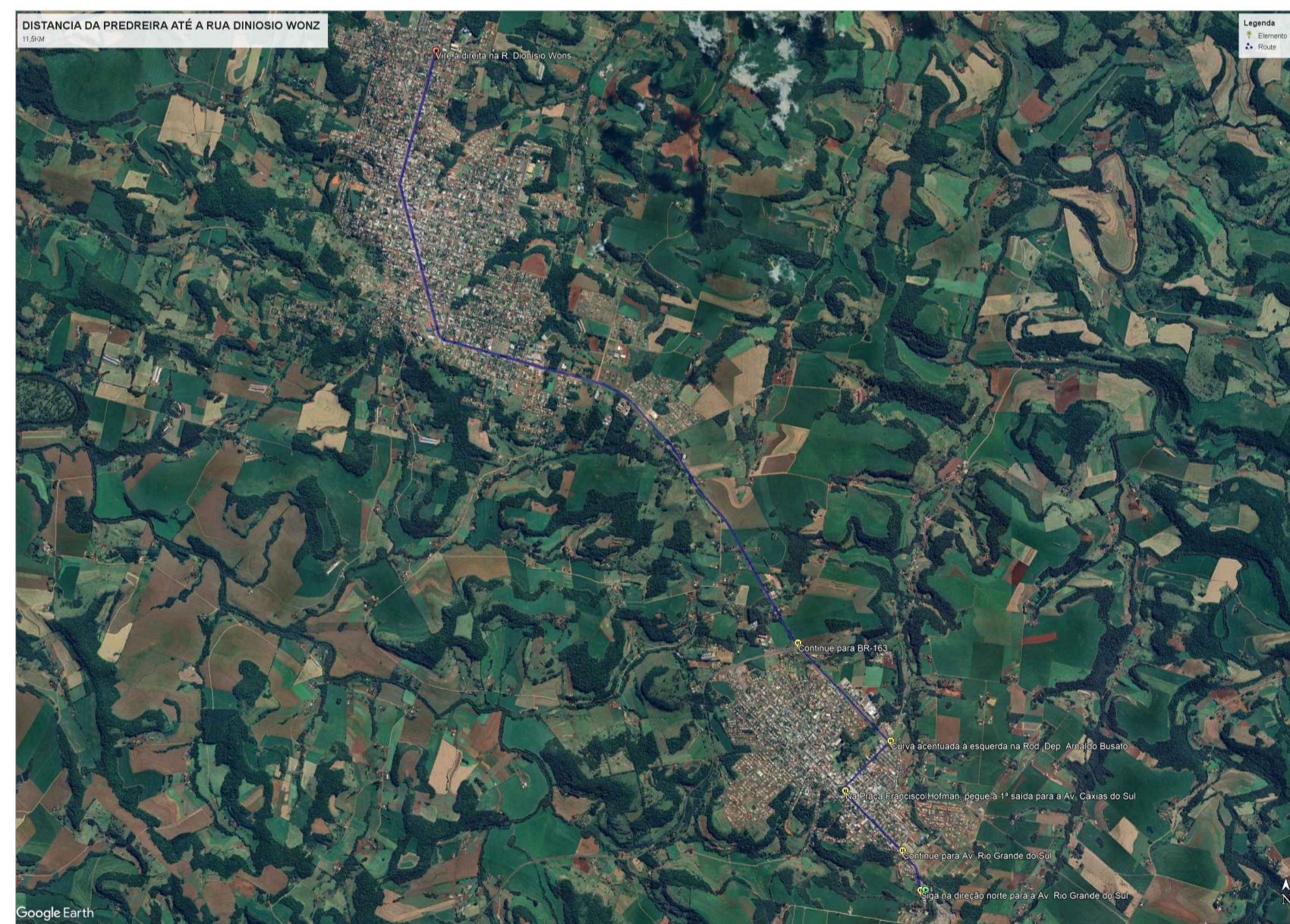
DISTÂNCIA FIXA DA PEDREIRA AO INÍCIO DO TRECHO 11,5Km